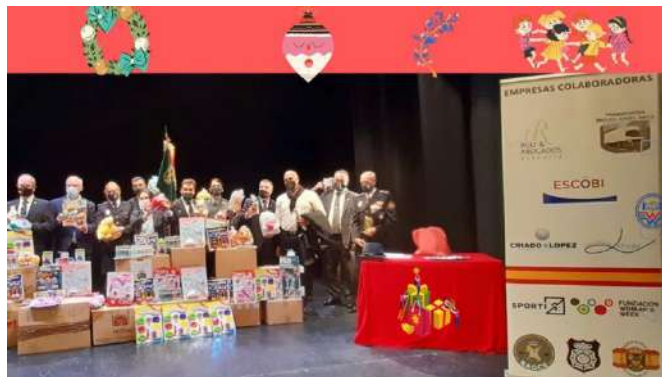
Pincha en las imágenes para acceder al reportaje fotográfico del evento

https://madrid-womans-week.com/esporti-paricipa-en-una-campana-que-repartira-mas-de-10-000-juguetes-a-los-ninxs-desfavorecidos/